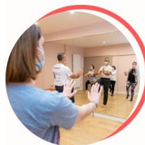
Activité Physique Adaptée