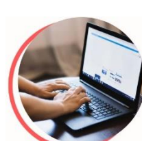
Ateliers en ligne