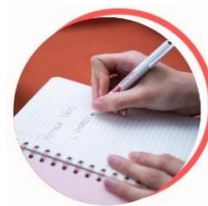
Maintien et retour à l'emploi