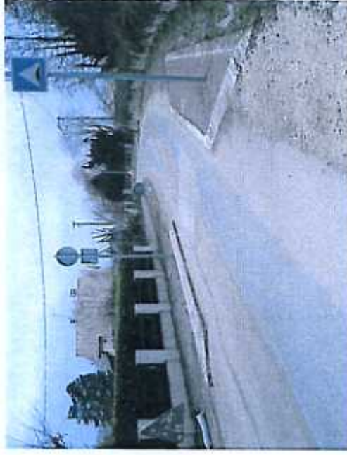
Un exemple de rétrécissement de la chaussée

L'équipe municipale a poursuivi les engagements pris en début d'année pour sécuriser et contrôler les vitesses excessives dans différents quartiers de notre commune.