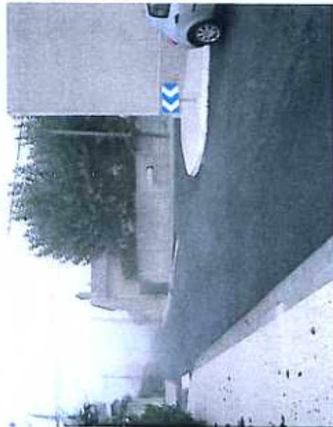
Aménagement Quartier Le Tauzin