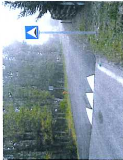
Ralentisseur du quartier Le Basque

Les différentes réalisations de voirie sont en cours d'achèvement, ou terminées.