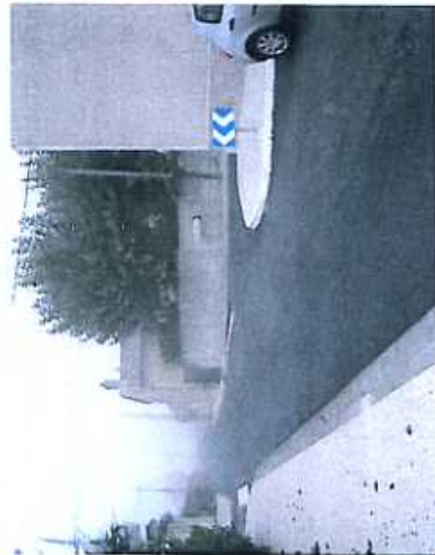
Aménagement Quartier Le Tauszin